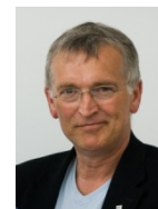
Tekniske, økonomiske og maritime fag